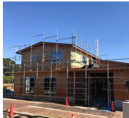
外壁工事も始まり、ようやく全貌がわかり始めました。内装工事も本格化していきます。