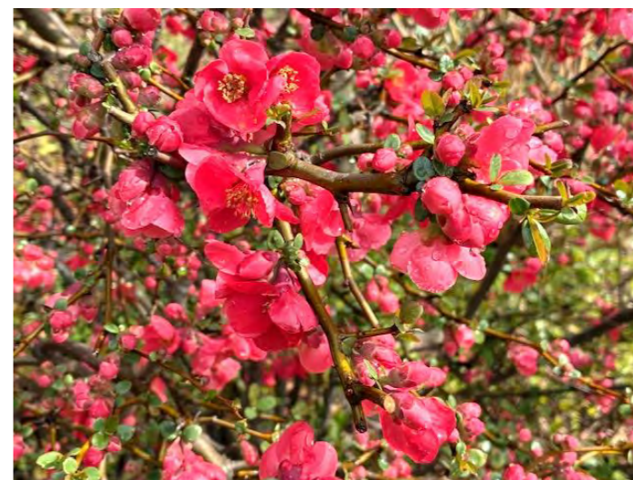
ボケ（木瓜）の花 訪問先のお庭で